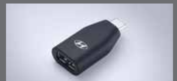
C to USB-A 변환 젠더

※ 위 H Genuine Accessories는 쏘나타 N Line 차량에도 적용 가능합니다. ※ LED 라이팅 플러스 패키지의 도어스텝 램프는 1열에만 적용됩니다. ※ C to USB-A 변환 젠더는 현대자동차 전용 개발 제품으로 타 제품 및 타 자동차 브랜드에서는 작동을 보장하지 않습니다. ※ H Genuine Accessories 신차 옵션 상품 선택 시 납량, 철국, 영남 출고센터에서만 출고가 가능합니다. ※ 위 상품은 트림 및 옵션 선택에 따라 적용 가능 여부가 달라질 수 있습니다. 자세한 사항은 해당 월의 가격표를 참고해 주시기 바랍니다. ※ H Genuine Accessories 신차 옵션 상품 선택 시 기존에 장착된 부품의 처리 비용은 해당 패키지 판매가격에 반영되어 있어 별도의 보상은 없습니다.