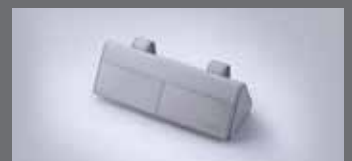
선바이저 선글라스 케이스